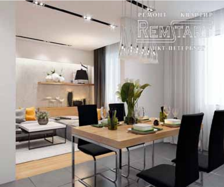
Фото ремонта квартир в новостройках, старом фонде города, смотрите портфолио на сайте remstart.ru , где фотографии говорят о нашей работе деталями!